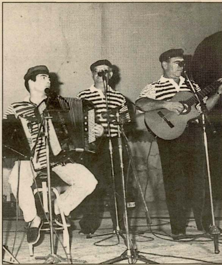
El grup Terraferma realitzarà una cantada d'havaneres.

Per exemple, enguany, arriba a Alpicat per primera vegada la cursa de llits, molt en voga en altres llocs però que encara no s'havia fet mai en aquesta localitat. Uns altres esdeveniments d'aquest estil són una costellada a les cinc de la matinada, una gimcana automobilística o bé la guerra d'aigua, actes més aviat pensats per tal que el jovent d'Alpicat tingui unes activitats més mogudes. Ja se sap: "gent jove, pa tou!!"