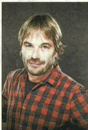
Masferrer portarà a escena 'Bona gent' divendres a la nit a la sala La Unió.

Tot seguit, celebració de la Santa Missa, cantada per la coral Sant Bartomeu.