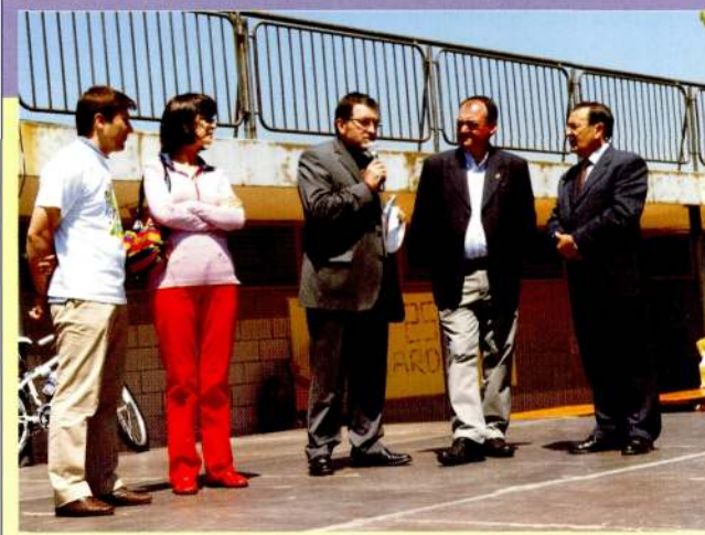
1 de maig de 2009. 25è aniversari del CEIP Doctor Serés, amb l'assistència del director dels Serveis Territorials d'Educació a Lleida