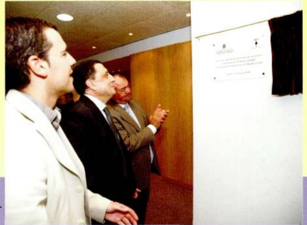
15 de maig de 2009. El director dels Serveis Territorials de Governació i Administracions Públiques a Lleida va inaugurar la 3a fase de l'edifici La Unió. A l'acte va assistir el coordinador territorial de Joventut a Lleida