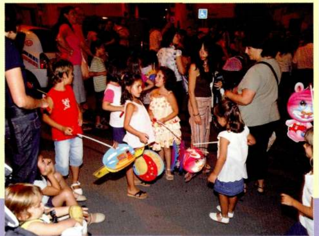
24 de juliol de 2009. Processó dels fanalets de Sant Jaume