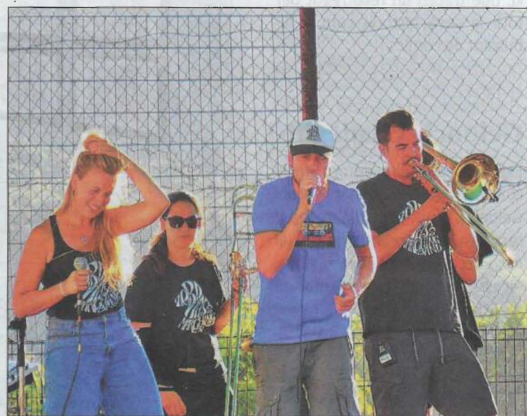
El grup va fer dues actuacions, al matí i a la tarda

vocada per la pandèmia de coronavirus. El sector demana un pla de xoc a les administracions i que mantinguin les programacions culturals previstes.