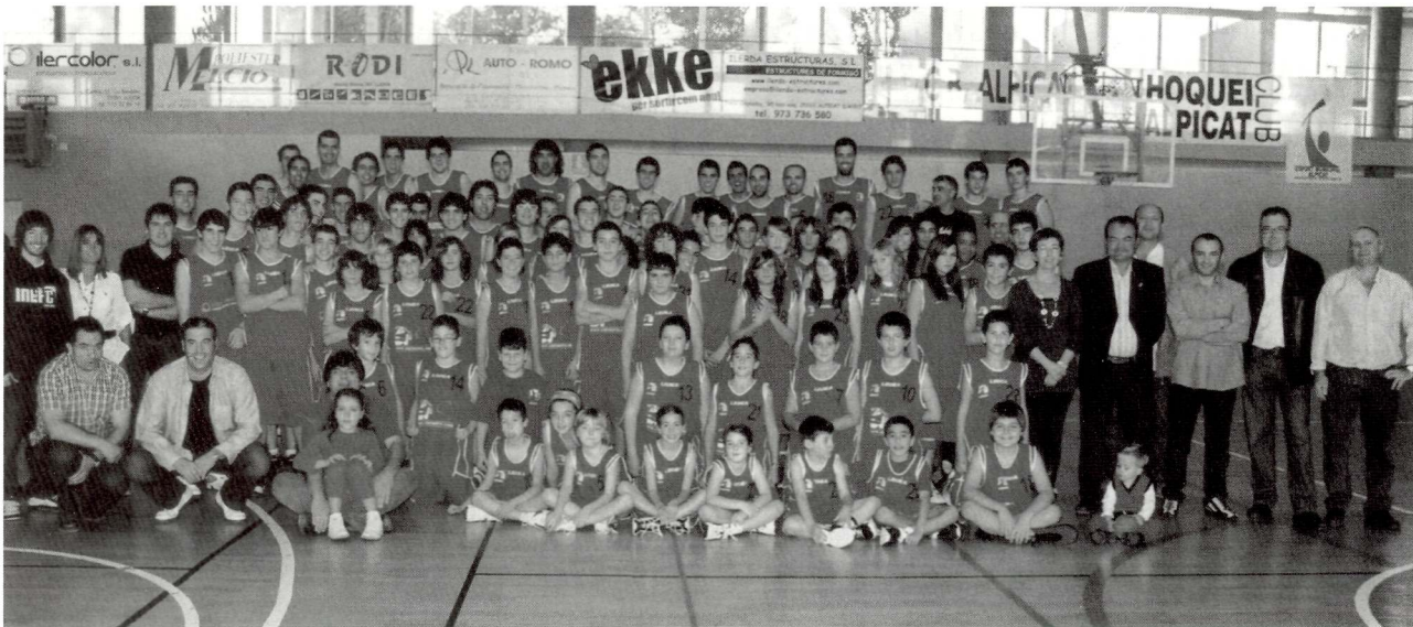
La gran família del Club de Bàsquet Alpicat