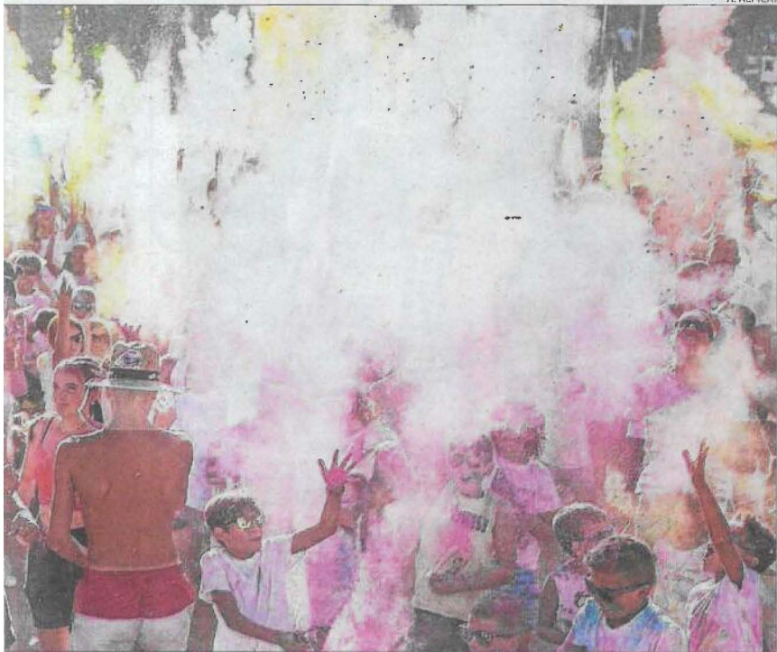
Dissabte a la tarda veïns i forans tant es podran submergir en la festa holi com ballar al ritme de la Principal de la Bisbal.