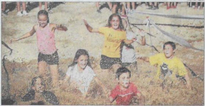
Fang, aigua i diversió a dojo són els ingredients de l'Alpifangada.