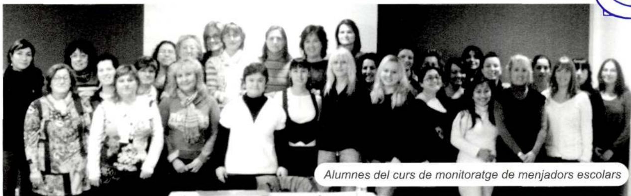
Alumnes del curs de monitoratge de menjadors escolars