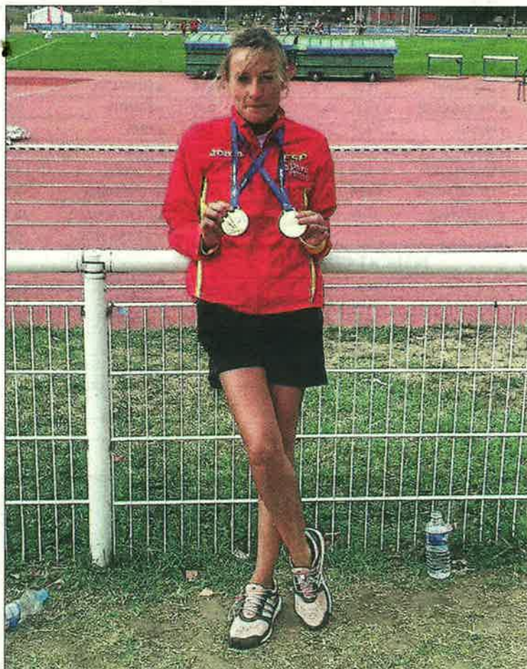
L'atleta lleidatana amb les dos medalles d'or aconseguides a Lió.

des que es va jubilar i és habitual a les proves estatals i internacionals. El lleidatà, natural d'Alcanyís, va acabar la marató amb un temps de 2:57:05, i es va quedar molt a prop de la medalla de plata. Al Campionat del Món de veterans també va participar l'atleta lleidatà Ramon Trullols, del Xafatolls, que va finalitzar la prova de marató de 40 anys al lloc 34.