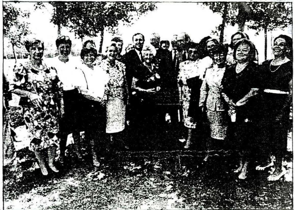
Las autoridades, en las piscinas y — a la derecha — acompañando a las mujeres que colaboraron en las restauración de la cúpula de la iglesia.

La cúpula de la iglesia fue reconstruida por las mujeres del municipio