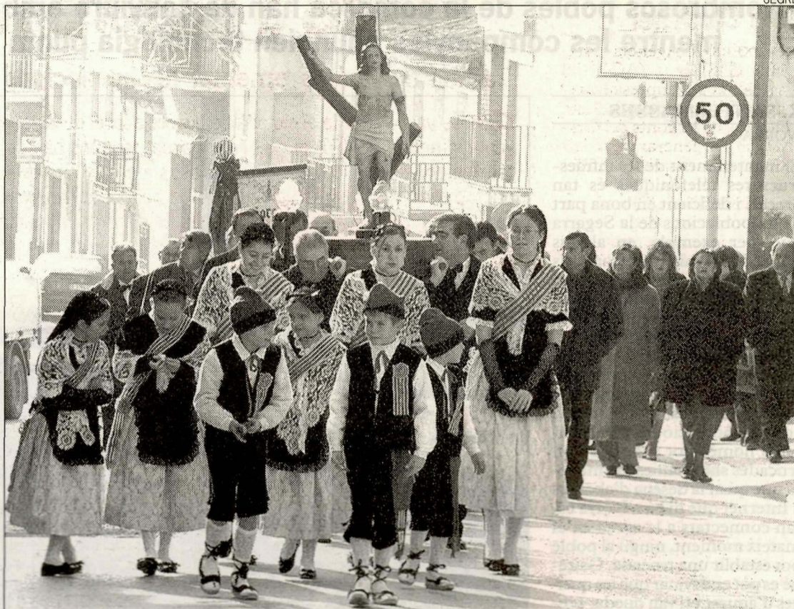
La localitat honorarà el patró amb una processó i missa cantada per la coral.

L'exhibició és una de les novetats de la festa, que inclou un Open d'escacs i amplia les sessions de ball