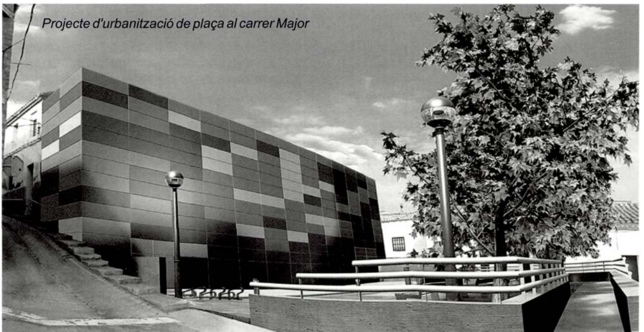
Projecte d'urbanització de plaça al carrer Major

4. Reordenació del trànsit a la cruïlla del carrer d'Enric Granados amb la Sardana i de la Concòrdia, segons memòria valorada de l'enginyer tècnic David Martínez Espax, de data 15 de gener de 2009, que puja per tots els conceptes cent vint-i-tres mil tres-cents cinquanta euros amb onze cèntims (123.350,11 euros).