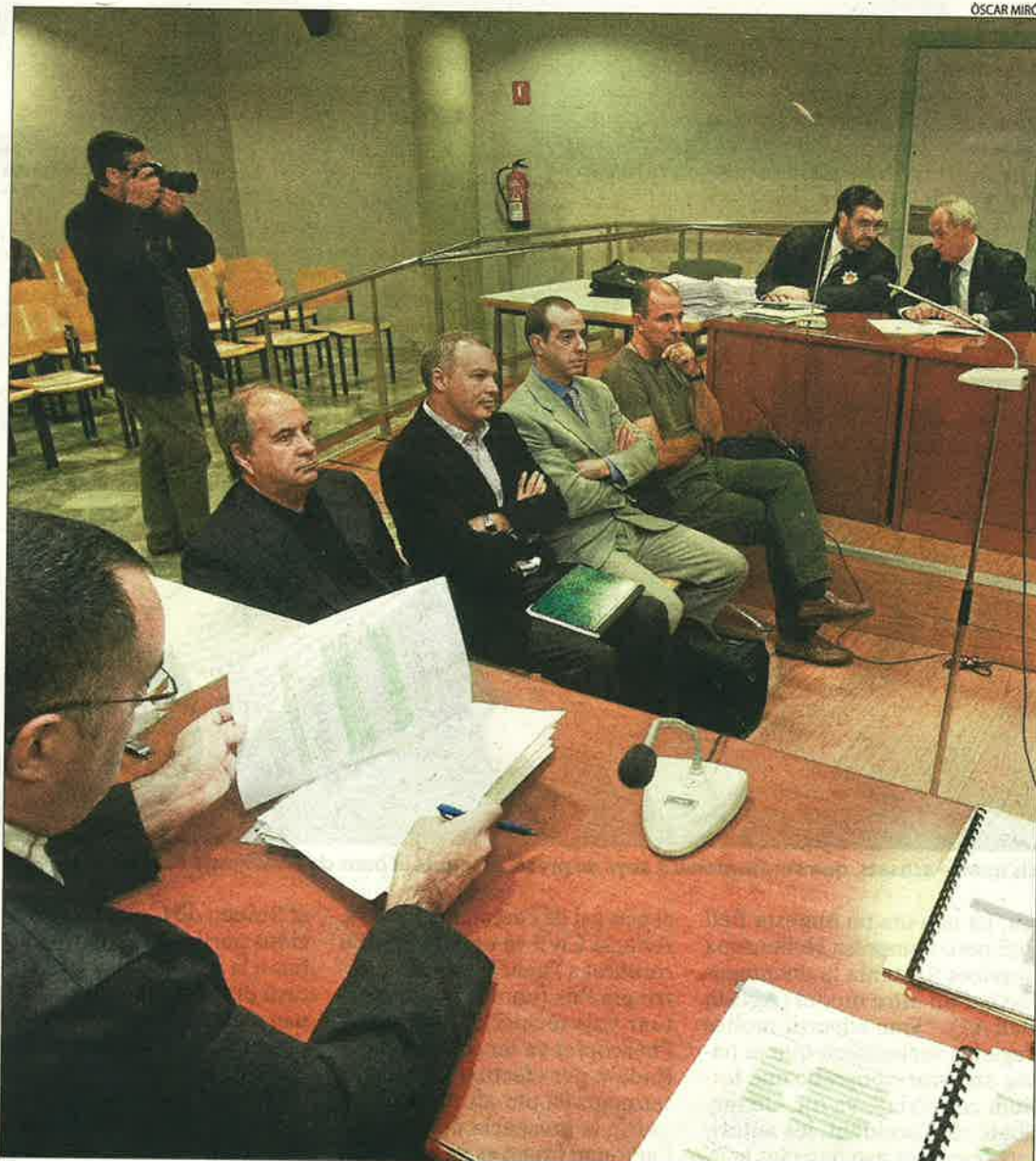
Una quinzena d'advocats estan personats en la causa.