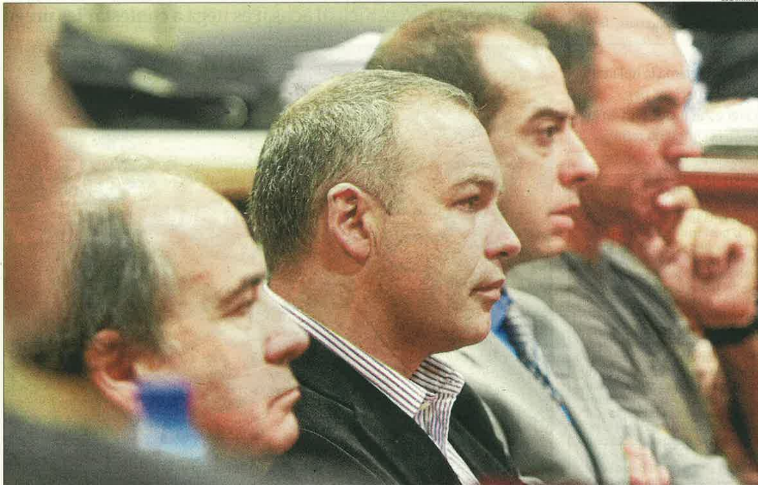
Els quatre acusats, que s'enfronten a 5 anys de presó, asseguts al banc de l'Audiència Provincial abans d'iniciar-se el judici.

LLLEIDA | La tragèdia de Torallola va arribar ahir a judici nou anys i quatre mesos després que l'Augusta Bell 205 en què viatjaven vuit persones es partís literalment en dos i caigués al buit al juny del 2002. Els quatre acusats s'enfronten a cinc anys de presó. El propietari de l'empresa propietària de l'aeronau, Pedro Sáenz de Maturana, va eludir totes les responsabilitats i les va atribuir totes al pilot de l'aeronau, mort en el sinistre. Segons la seua versió, va ser el pilot qui va permetre pujar passatgers a l'helicòpter (encara que no tenien permís per fer-ho), i va superar el dia del sinistre les cent hores de vol consecutives sense la revisió corresponent. El pilot, Vicenç Roselló, no es pot defensar. "Van fer un vol prohibit i el responsable va ser el pilot", va afirmar Maturana. "Mai vam donar autorització, aquelles persones no tenien per què pujar-hi, el que van fer no estava autoritzat", va assegurar. A més, va indicar que ell "no podia decidir que la nau volés, el comandant tenia aquesta responsabilitat", va afirmar. També va culpar el pilot que l'aeronau volés més de cent hores seguides, en contra del que estableix la normativa. Segons sembla, diuen les defenses, el dia de l'accident l'helicòpter va superar les cent hores de vol sense inspecció. "És una irresponsabilitat volar més de cent hores seguides, no ho hauria d'haver fet", va assegurar Maturana. Durant dos hores, l'acusat es va mostrar convençut que el seu helicòpter tenia els papers en re-