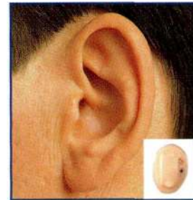
Invisible * so natural