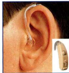
Clàssic so agradable