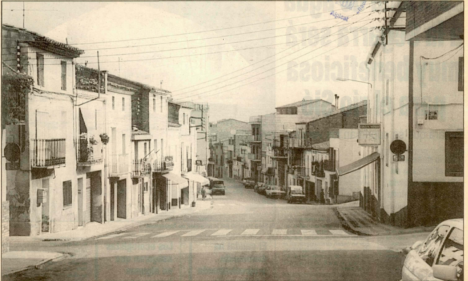
Els carrers i places de la vila s'ompliran de l'esperit de gresca i sarau que domina aquest dies.