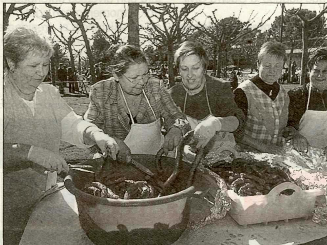
Las mujeres prepararon la 'cassola'