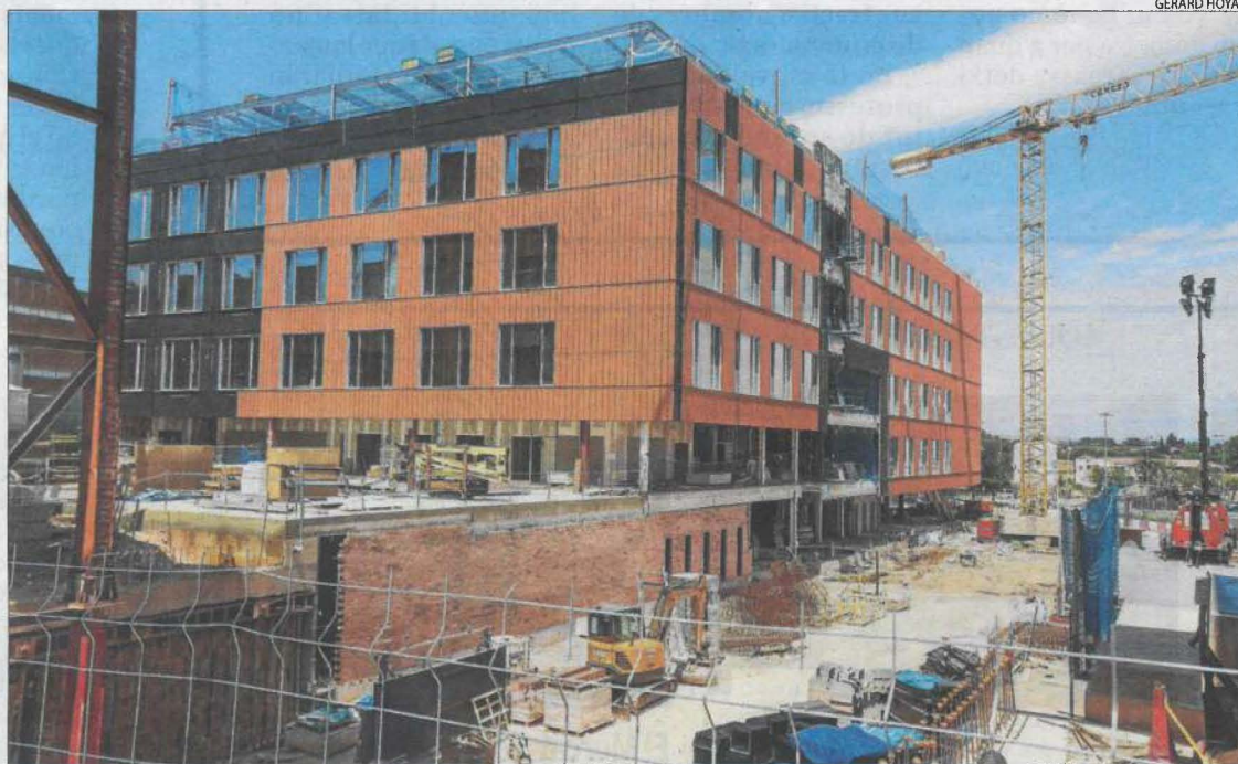
Les obres del nou edifici de consultes externes de l'Arnau encaren la recta final.

Mòduls ■ L'hospital Arnau ultima la construcció d'un edifici prefabricat, modular i desmuntable a la seua plaça principal per ubicar els serveis afectats per les obres del nou bloc quirúrgic. Acolirà 16 consultes externes, dos despatxos de protecció radiològica, dos més d'electromedicina, l'hospital de dia de Neurologia i àrees auxiliars d'ús personal sanitari.