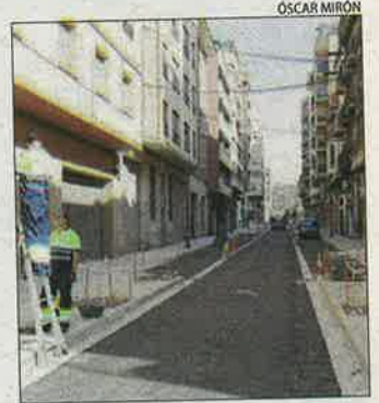
El tram afectat.