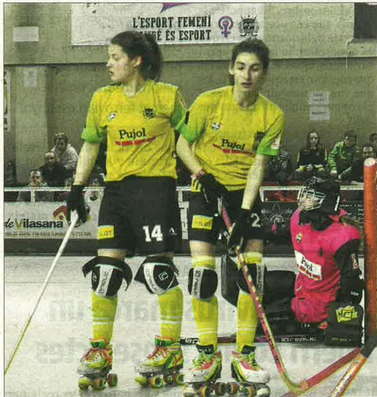
La represa de l'OK Lliga no tindria a penes incidència ni per al Llista ni per al Vila-sana, que ja pensen en la pròxima campanya.

i Vic i Lloret baixarien. Serien els dos únics descensos al no poder disputar-se el play-off amb els segons classificats de l'OK Plata, una situació que afectaria a la pista de l'equip de més categoria.