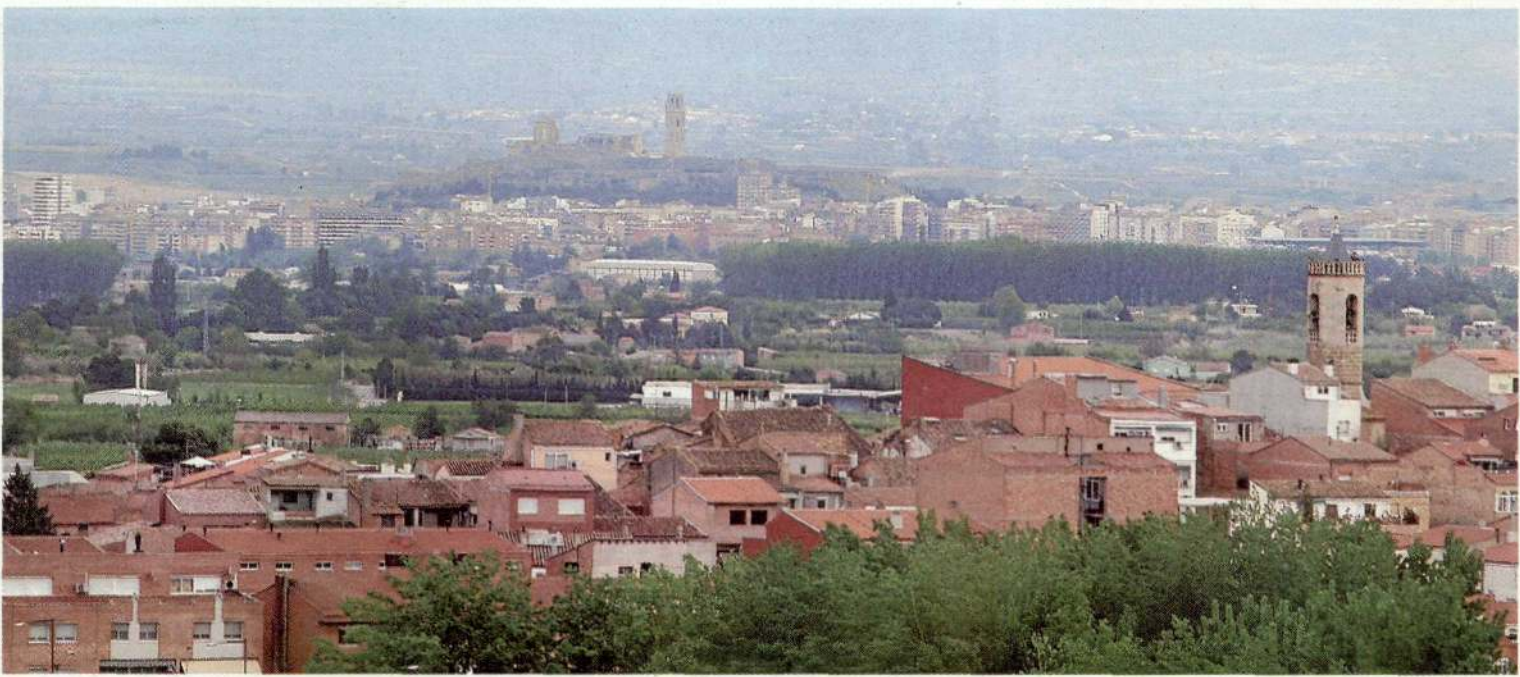
JOSEP PORTA BALLESPÍ. FONTS PORTA/IEI

PROXIMITAT. A només 4 km de Lleida, Alpicat era el poble (el cementiri) més proper a la capital.