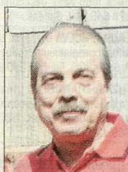
J.M. Triquell Tir