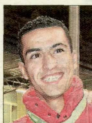
A. Merzougui Atletisme