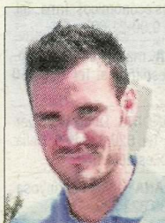
Saül Craviotto Piragüisme