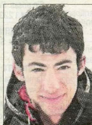
Kilian Jornet Curses de muntanya