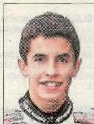
Marc Màrquez Motociclisme