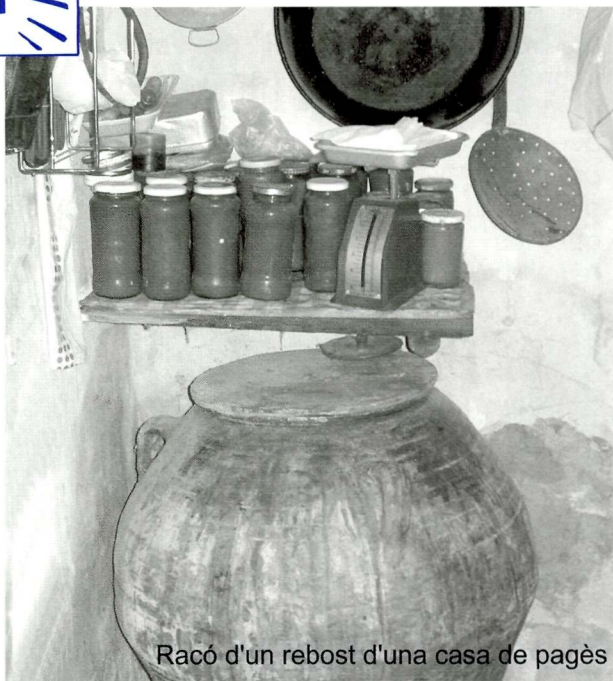
Racó d'un rebost d'una casa de pagès

Ja fa temps, sobretot durant els anys de la postguerra, entre molts joves de la localitat era habitual fer llunes. Les llunes eren petits robatoris que es feien a casa, de productes de pagès que s'havien arreplegat de les diferents collites, emmagatzemats normalment a les golfes i rebosts, o d'aquells que provenien de l'hort i de la cria dels animals del corral. S'emportaven sobretot gra (cereals), olives, ametlles i ous per vendre-ho, a un preu més baix que el que es pagava a les botigues i mercats, a persones que es dedicaven a comprar aquests tipus de productes procedents dels furts domèstics.