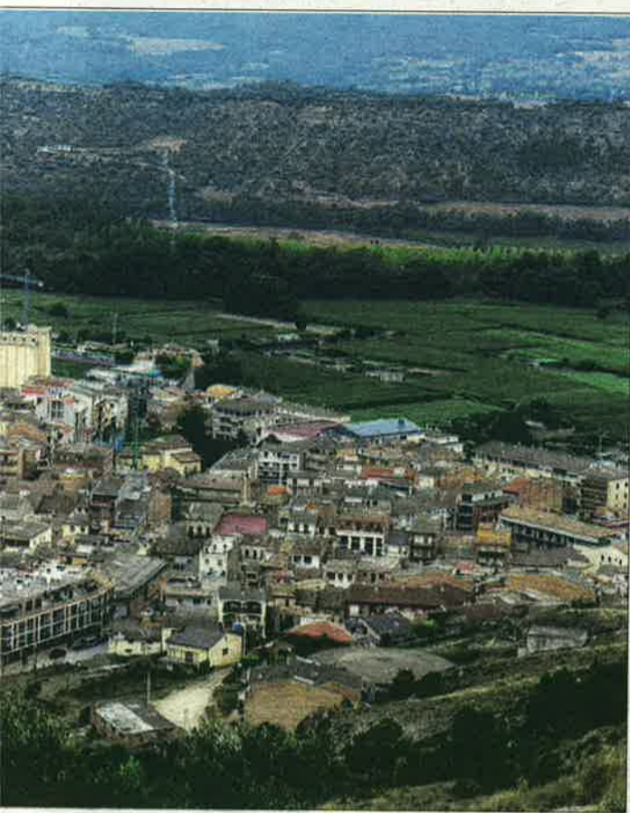
La capitalitat de la nova comarca

mitjans.” I hi va afegir: “La ciutadania haurà de dir alguna cosa envers aquest assumpte.”