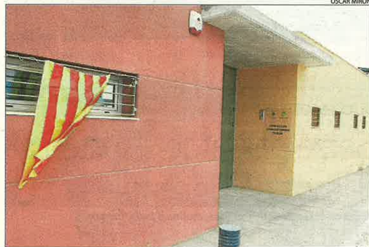
Les instal·lacions estan a punt per obrir des del 2010.