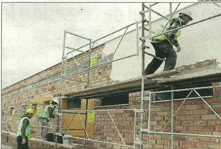
Les obres de la canera es van començar el 2008.