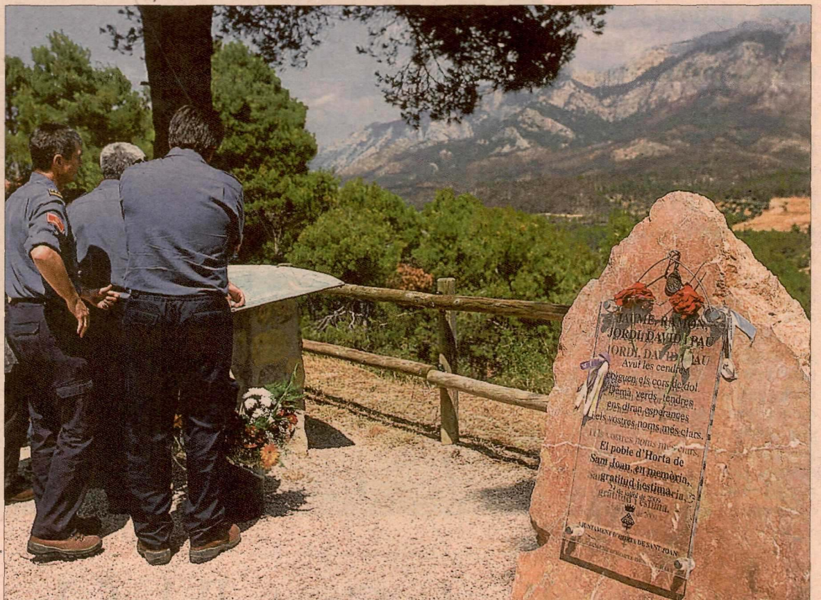
Bomberos rindiendo homenaje a sus compañeros muertos en el incendio de Horta de Sant Joan