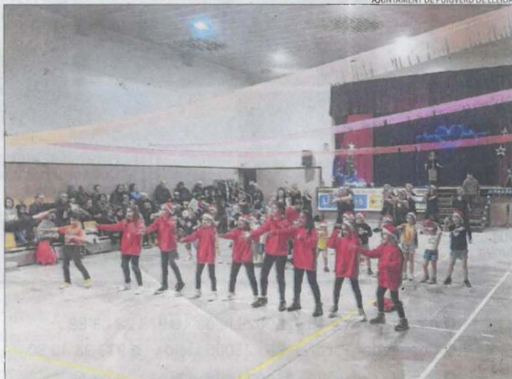
La sala de ball, epicentre de La Marató a Puigverd de Lleida. El municipi va recaptar un total de 2.135 € per a la Fundació La Marató.