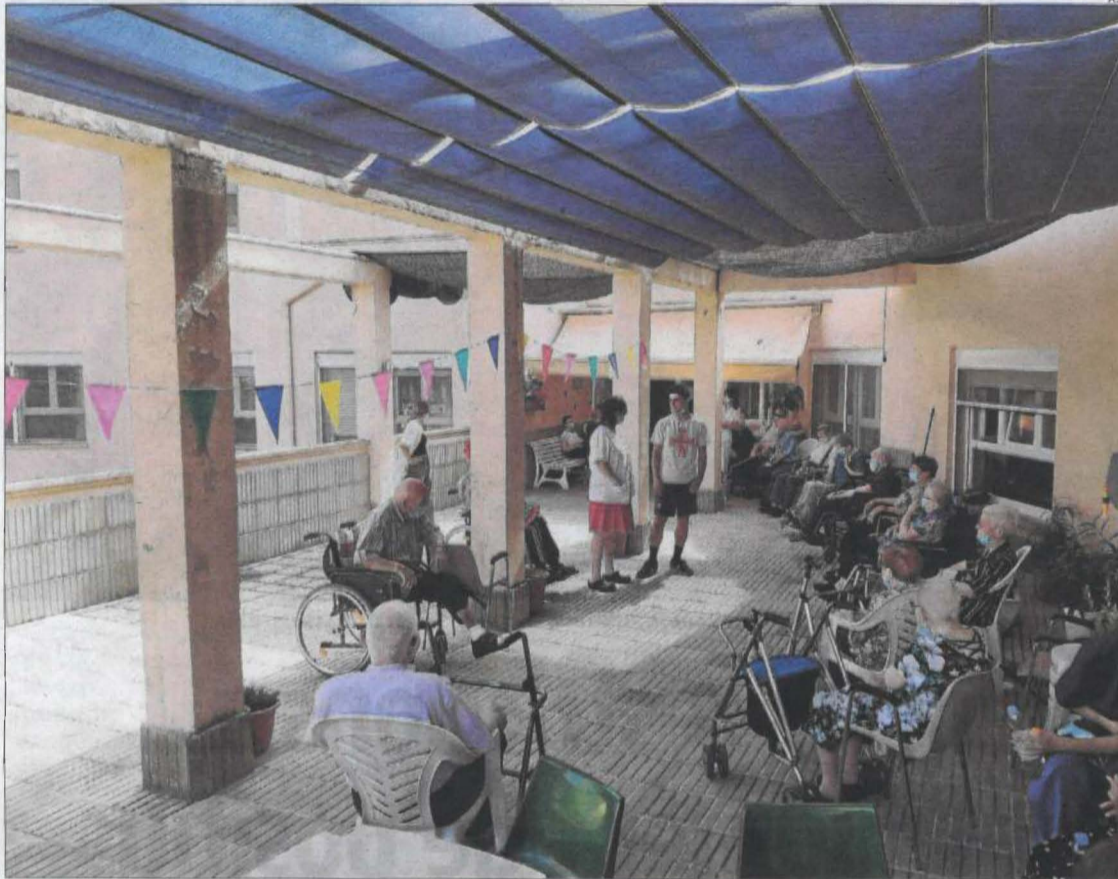
Imatge dels usuaris de la residència d'Àger, que ja ha tornat a rebre visites dels familiars.

Tampoc reben visites el geriàtric públic de Juneda o els dos de Cervera.