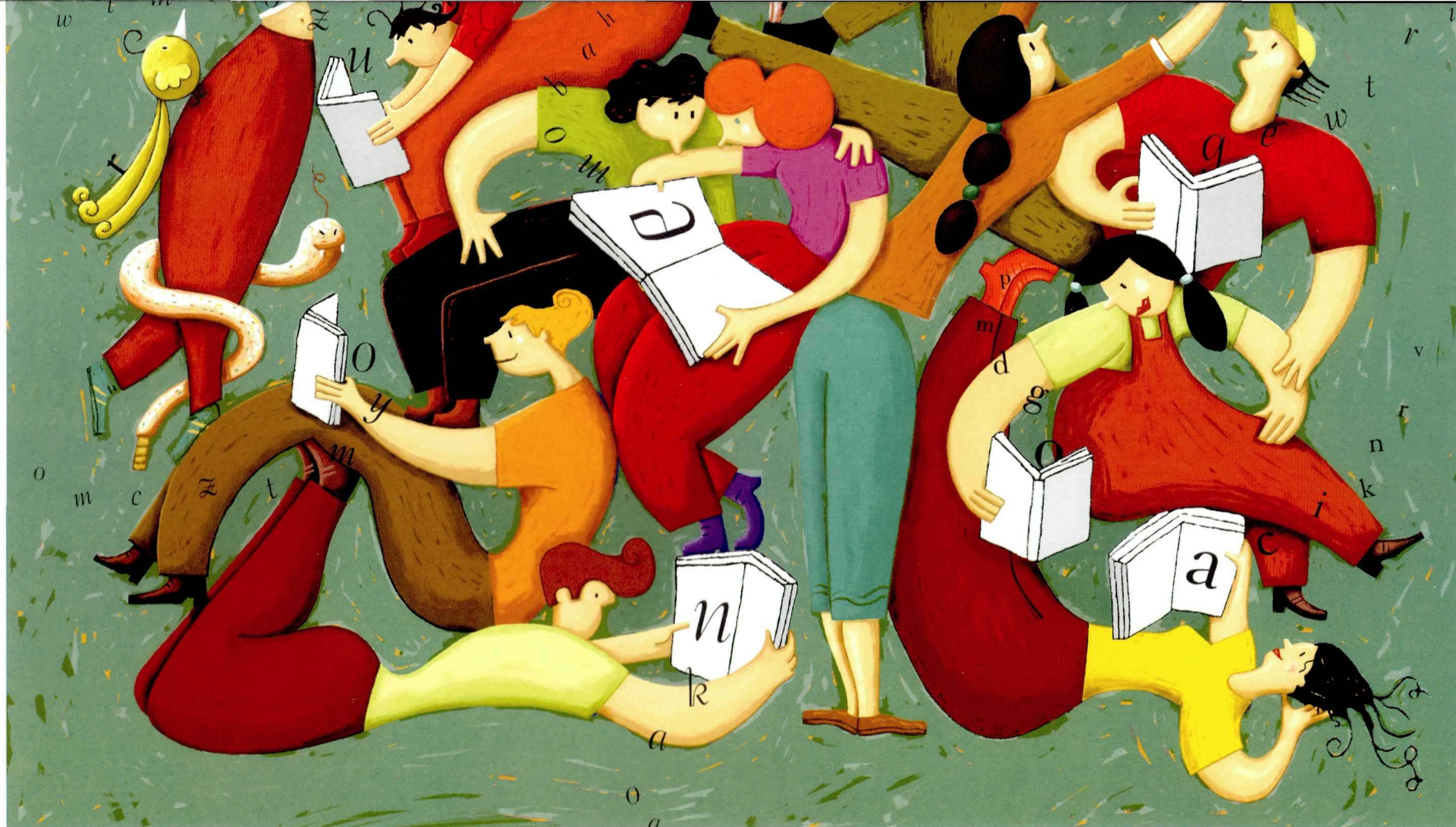
Lluís Cadafalch 2000

La Seu d'Urgell , Biblioteca Comarcal Sant Agustí