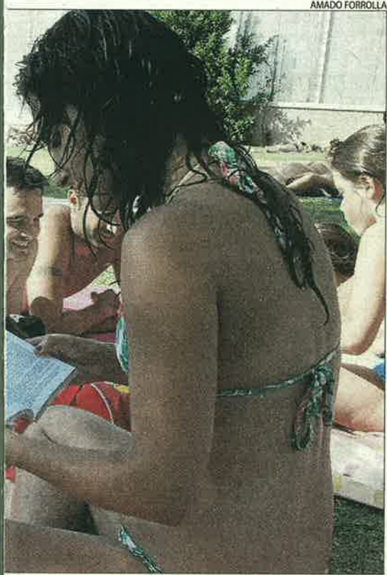
un bon llibre.

Malgrat que molta gent compra llibres de segona mà, al setembre les llibreries augmenten les vendes amb els llibres de text, lectures obligatòries i manuals universitaris.