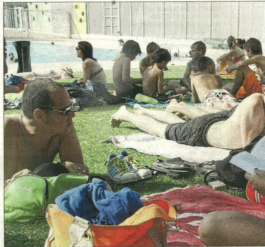
La piscina, el sol, el bon temps i els dies de descans propicien passar l'estona llegint