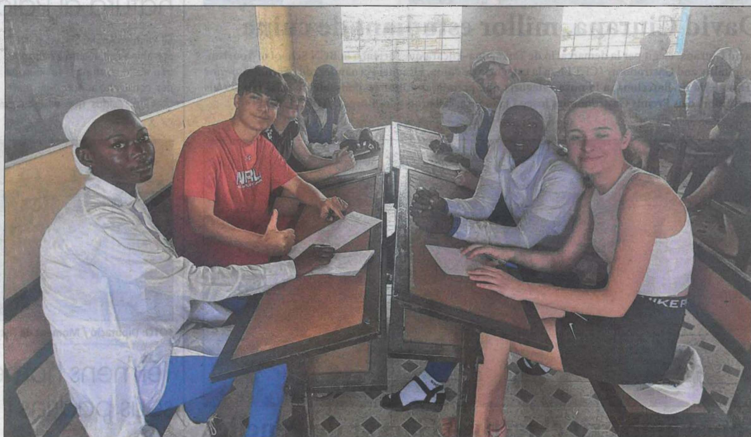
Treball conjunt dels alumnes de l'Institut Manuel de Montsuar amb els alumnes de l'Institut de Baja Kunda, a Gàmbia

L'objectiu principal del projecte és l'educació per a la transformació social i la sensibilització, "perquè els alumnes participants puguin esdevenir agents sensibilitzadors i transmetre la realitat de la vida a Gàmbia, inclòs el perquè de les migracions cap aquí i la situació de les persones que viuen aquí", va assenyalar Cayue-