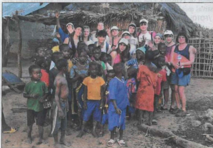
Visita al poblat de Sare Guideh