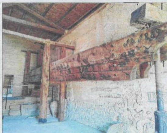
El Tossal i mirador d'Almatret, la cuina o el molí Bep de Canut de Torrebesses, alguns dels atractius.

En l'equador de la campanya oleícola, el Segrià reivindica la "verdor que omple el cor". És el lema del projecte Segrià, Terra d'Oli, que convida durant el novembre i el desembre a descobrir l'important patrimoni natural, arquitectònic,