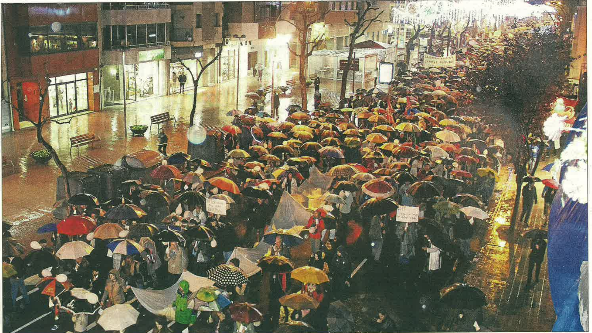
Paraigües i impermeables contra la pluja. Imatge de la protesta al seu pas pel carrer Balmes, amb els participants protegint-se de la pluja com podien.