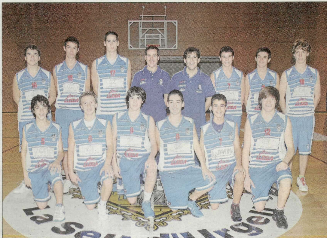
El Sedis es va imposar en la final al Sícoris per proclamar-se campió de Lleida.

El Sedis va guanyar la final del torneig federació, on per mèrits propis es va proclamar campió de Lleida davant d'un Sícoris que va vendre cara la derrota i que va lluitar fins a l'últim al·le.