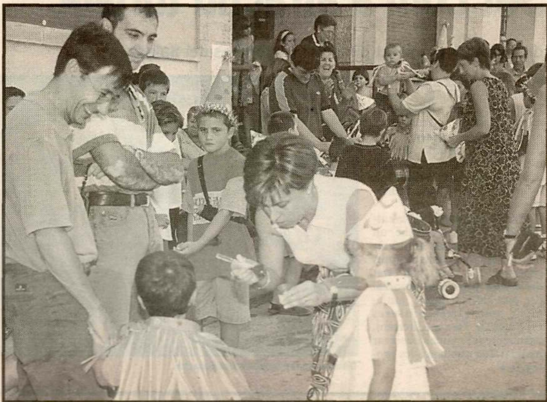
Gegants, grallers i nens disfressats prendran part a la desfilada, que inclourà personatges com bufons o acróbates.