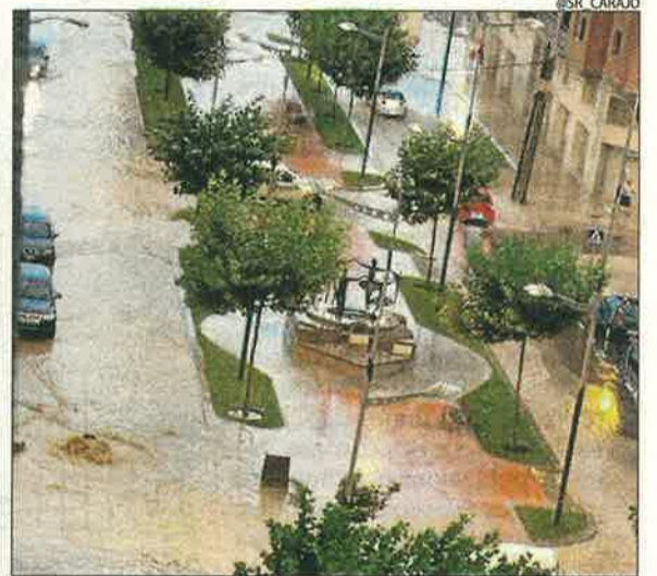
Un carrer inundat a Almacelles.