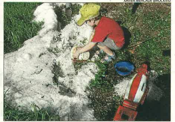
Restes d'una calamarsada a Benavarri.