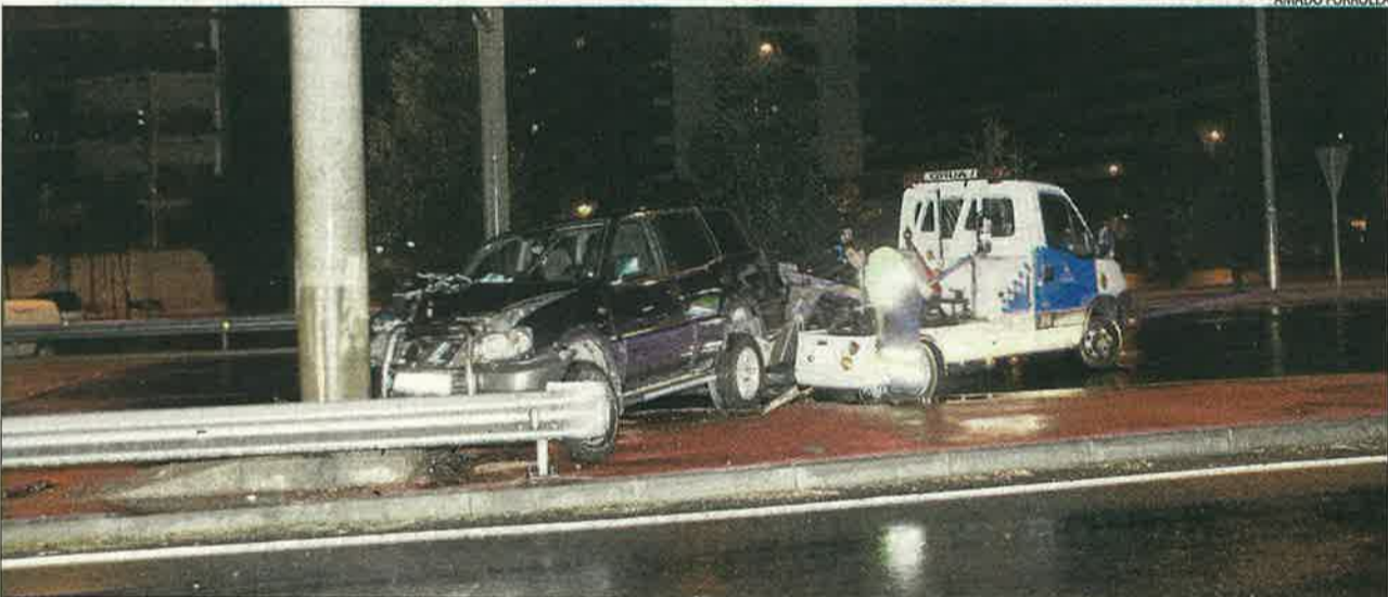
Aquest cotxe es va encastar a l'encreuament de la LL-11 amb Estudi General com a conseqüència de la pluja.