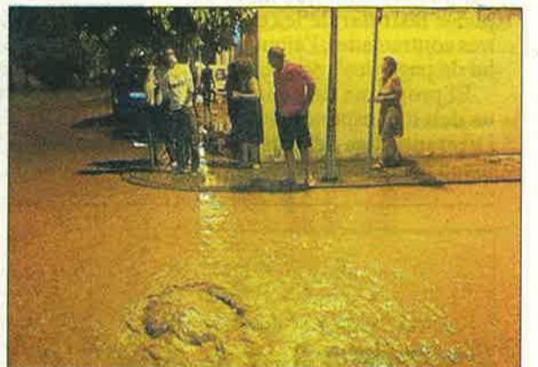
Un carrer de Gimenells, totalment negat.