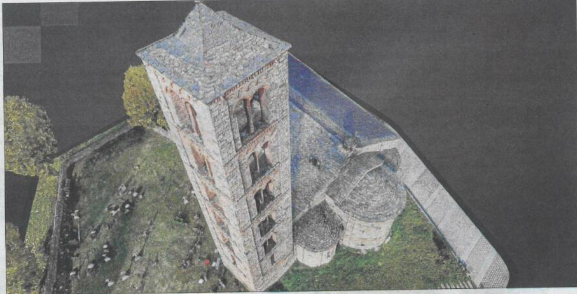
La visita virtual sobrevola Sant Climent de Taüll gràcies a imatges captades amb drons.

Per a la creació dels models es va utilitzar la tècnica de la fotogrametria, que consisteix a fer fotografies des de tots els punts de vista possibles de l'edifici, tant a dins com a l'exterior. En aquest cas, es van utilitzar drons per a les captures d'imatge de cobertes i campanars. I per aconseguir la reproducció al detall es van fer milers de fo-