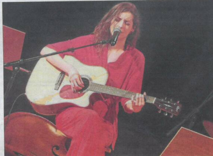
La cantant Emília Rovira, dissabte passat a l'Auditori de Lleida.