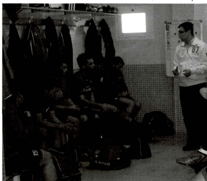
Xerrada tècnica abans de l'inici del partit