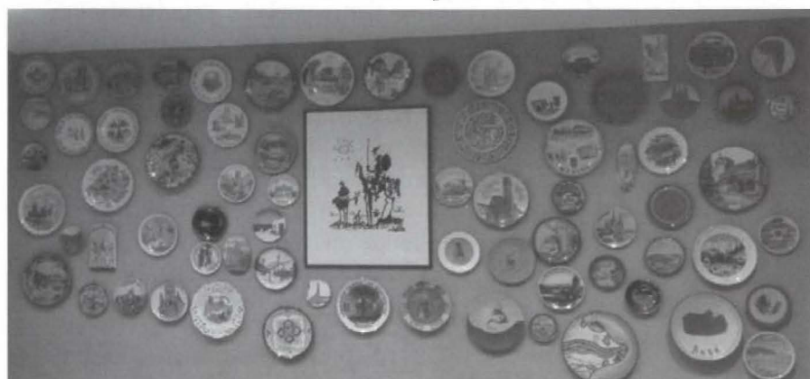
Platinos de recuerdo para colgar