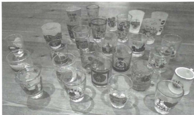
Vasitos recordatorios de ciudades

del Círculo de Lectores, maquinitas de hacer punta, matrioskas, mini botellas de licor, monedas y billetes, muñecas del mundo, pañuelos de cuello, pins, platos decorativos, Playmobils, posavasos, postales, programas musicales de mano, tazas, vasos de chupito, vacas, vinilos... Unas pocas quedaron pendientes, en algún caso debido al impedimento de poderse trasladar al lugar donde estaba la colección para fotografiar los objetos: antigüedades, botellas, marcapáginas, mundo Beatles, revistas, más imanes, más dedales, más cántaros y más platos. Quién sabe, quizás habrá segunda parte. Descubrimos ingentes colecciones, curiosidades, multicoleccionistas, gente muy viajera, objetos de gran valor, historias divertidas, colecciones ya estancadas y otras