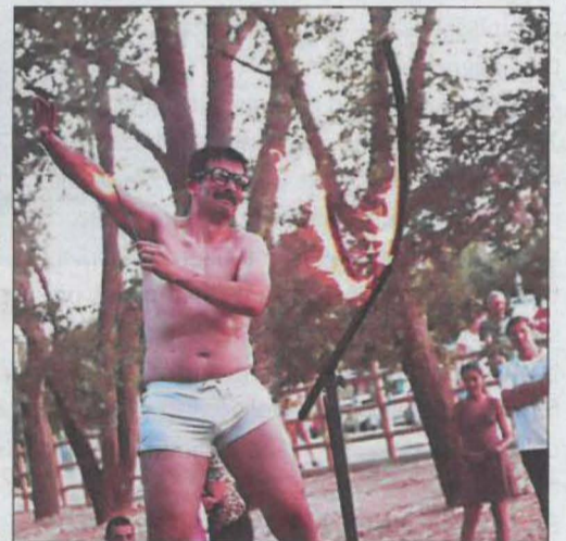
Els carrers d'Alpicat es van omplir per seguir els diferents espectacles programats dins el 'Circ Picat'