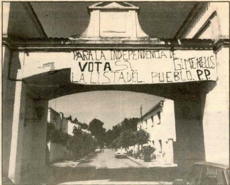
Gimeneles pide su desvinculación de Alpicat.

En el Pla los partidarios del "no" fueron 141 y los del "sí" sólo 58