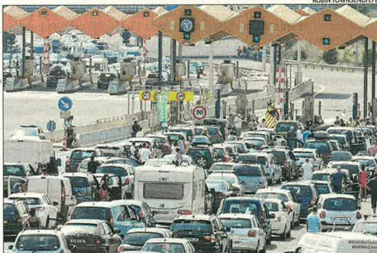
El tall dels peatges va provocar retencions, com mostra la imatge.