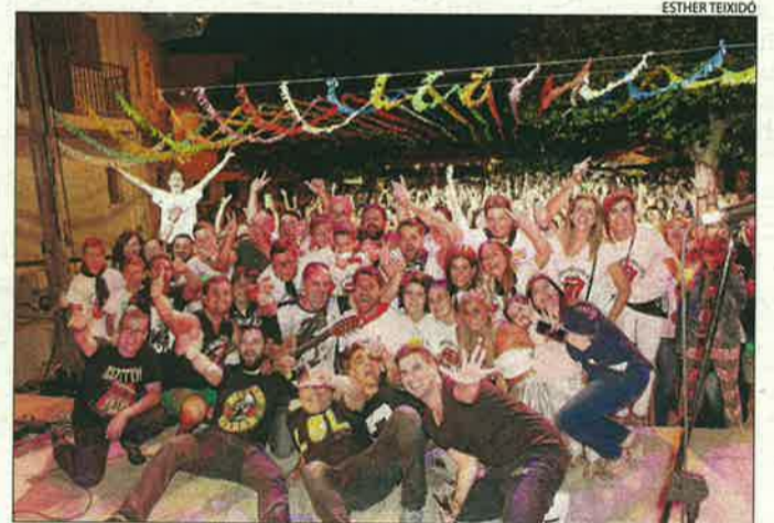
La Granja d'Escarp manté la festa major el 25 juliol.

Ager Albesa Arbeca Barbens Castelló de Farfanya Guixers Linyola Llardecans Llimiana Maials la Molsosa Odèn els Omells de na Gaia Organyà Rialp Sant Guim de la Plana Sarroca de Lleida Senterada el Soleràs Tarrés Torregrossa Vergós Guerrejat Vilaller Vilanova de l'Aguda Vilanova de la Barca