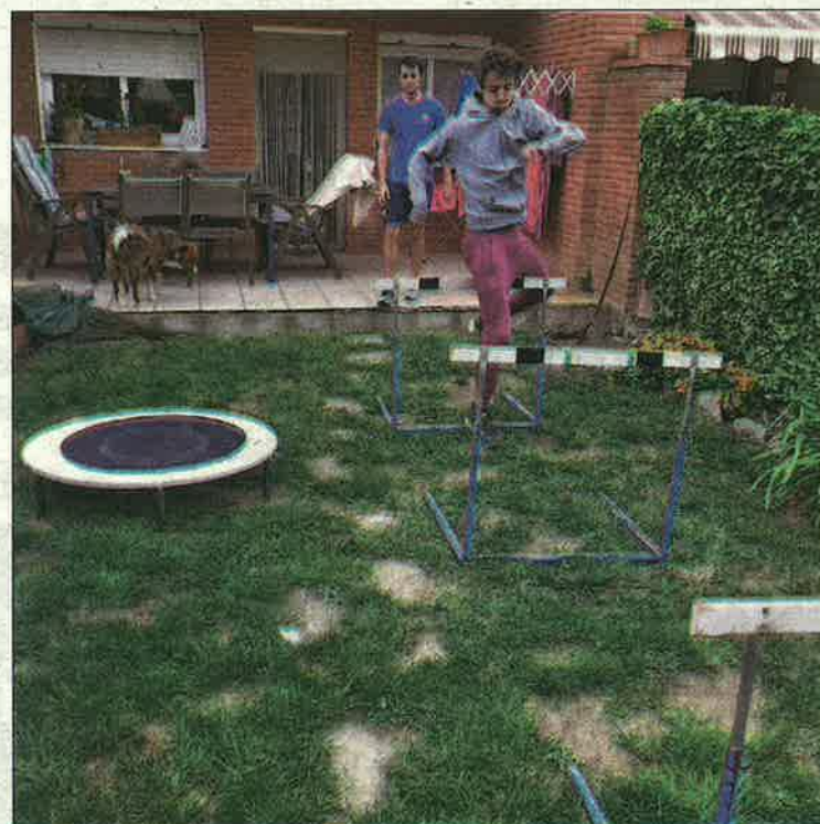
El entrenamiento se centra en la ejecución técnica