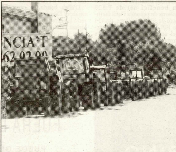
Tractors aparcats a la vorera, a la localitat d'Alcoletge.