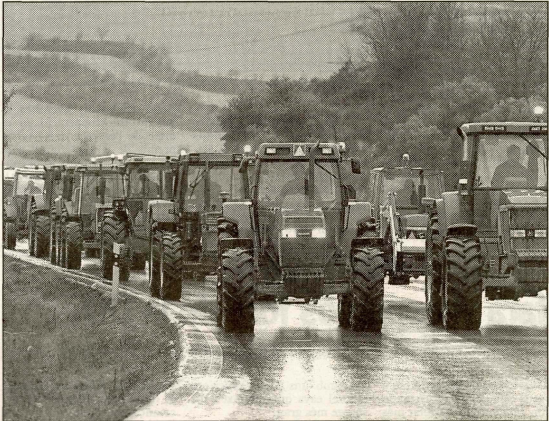
Els pagesos de la Segarra van protagonitzar una de les tractorades contra l'augment del gasoil.

Precisament, ahir a la nit, al poliesportiu de Bellpuig, Unió de Pagesos va celebrar una assemblea per explicar les raons de les mobilitzacions i per animar els presents a participar a la manifestació a Barcelona, informa J. R. Giribet. ●