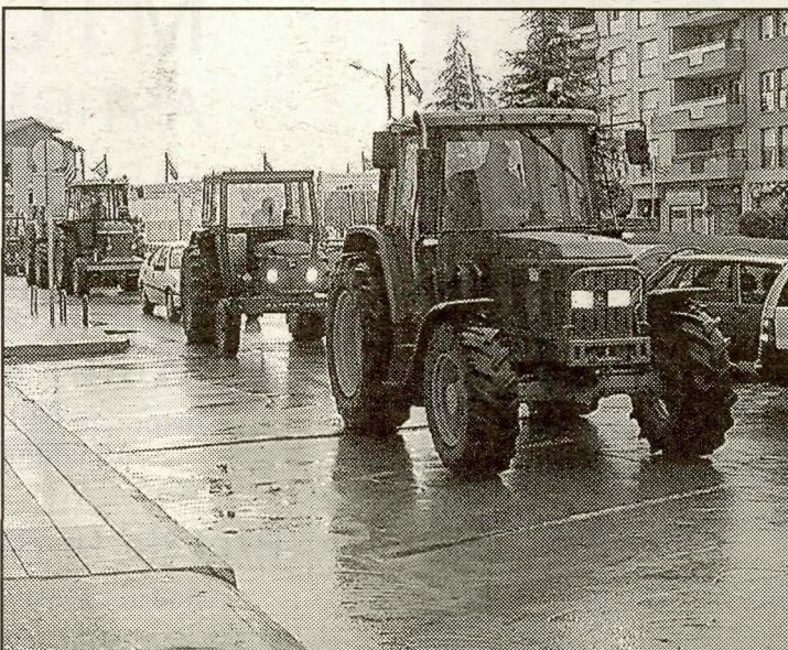
Els agricultors van entrar a Mollerussa amb els tractors.