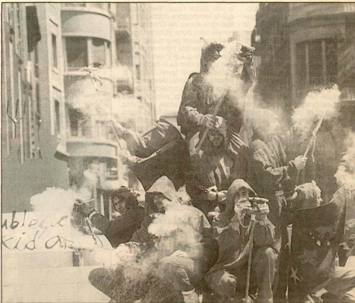
Diables de Lleida escenificarà un espectacular correfocs.

A la matinada, tots els assistents seran obsequiats amb coca i cava.