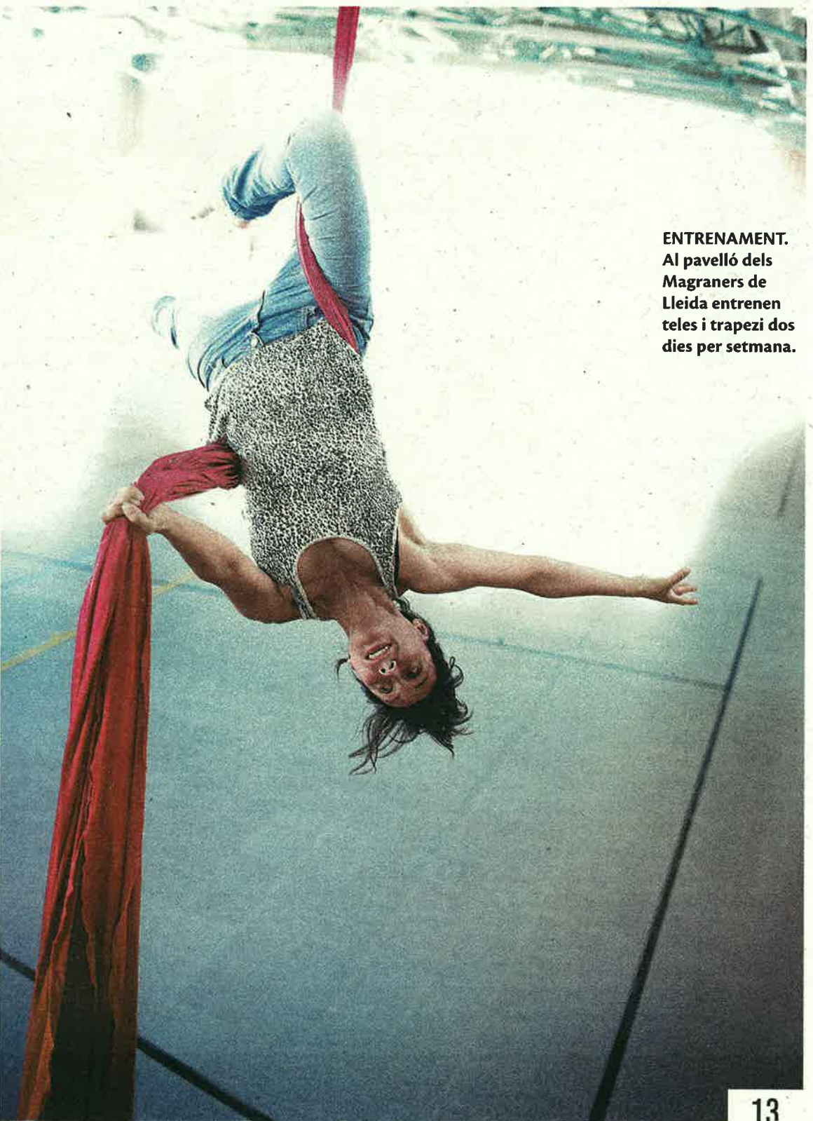
ENTRENAMENT. Al pavelló dels Magraners de Lleida entrenen teles i trapezi dos dies per setmana.