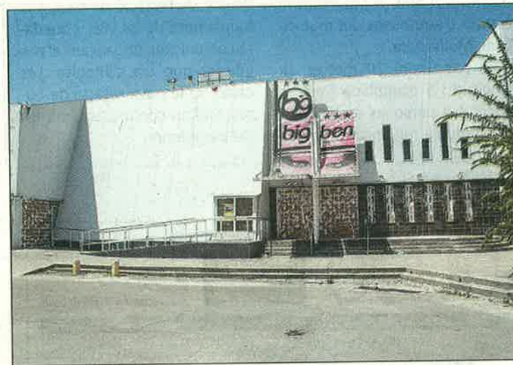
Desmantellen el complex per evitar saquejos

La direcció del complex Big-Ben va comunicar el passat divendres a través de Facebook el tancament definitiu de les instal·lacions i aquest dilluns ja es va fer oficial el tancament. El comunicat argumenta la clausura de l'activitat, com a conseqüència del canvi d'hàbits de la joventut i la situació econòmica actual. Al llarg de la setmana passada van desmantellar bona part de l'equipament, tant del restaurant com de la discoteca per evitar saquejos.