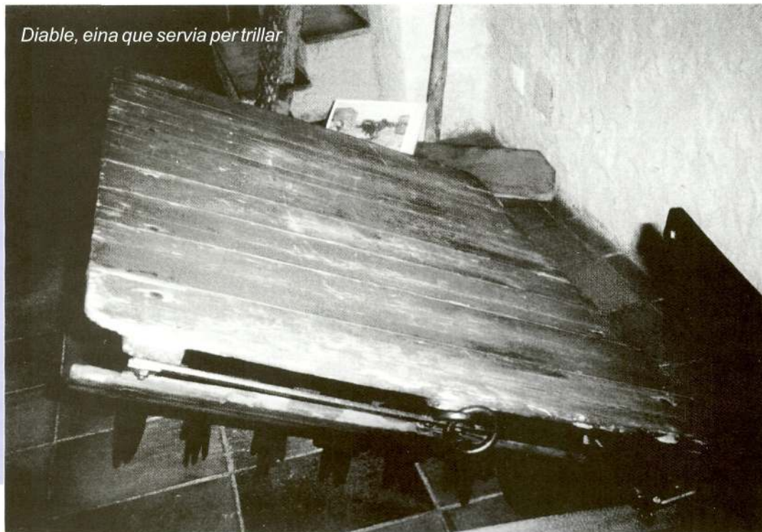
Diabla, eina que servia per trillar