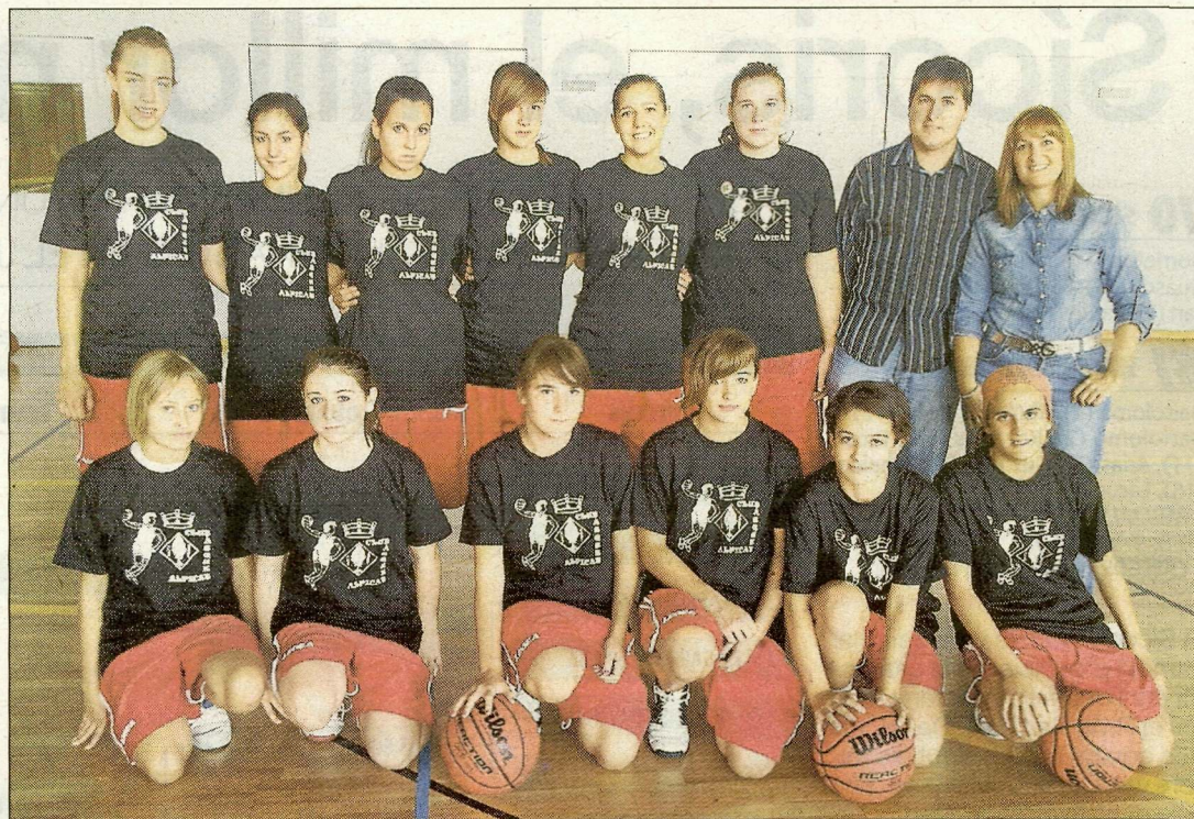
El cadet de l'Alpicat té encarrilada la seua presència a la final a quatre.

L'única victòria a domicili també va ser àmplia, la del Sedis Caditours a Agramunt (44-88) que deixa la semifinal en safata a les de la Seu. Finalment, la Penya Fragatina no va jugar el seu partit a Tremp.