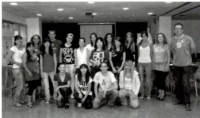
Alumnes del curs Monitors i Monitores d'Activitats de Lleure Infantil i Juvenil

En aquest sentit, aquestes polítiques esdevenen clau per facilitar l'equilibri del temps laboral, familiar i personal a partir d'un nou concepte d'organització de les empreses i de la planificació de l'entorn en relació amb la vida quotidiana de dones i homes.