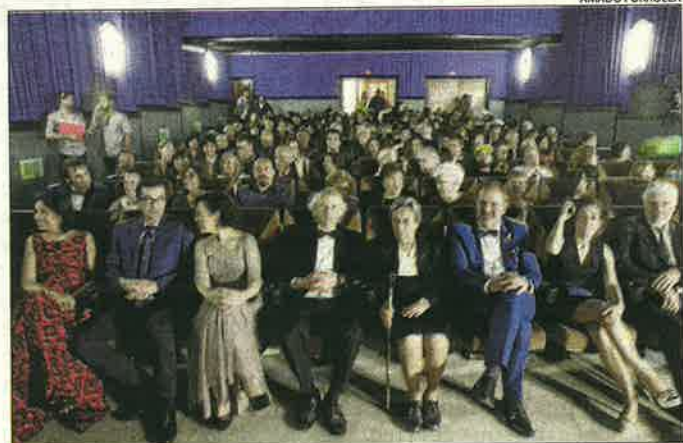
Reestrena 'televisiva' al maig del cine Kursaal de Penelles.