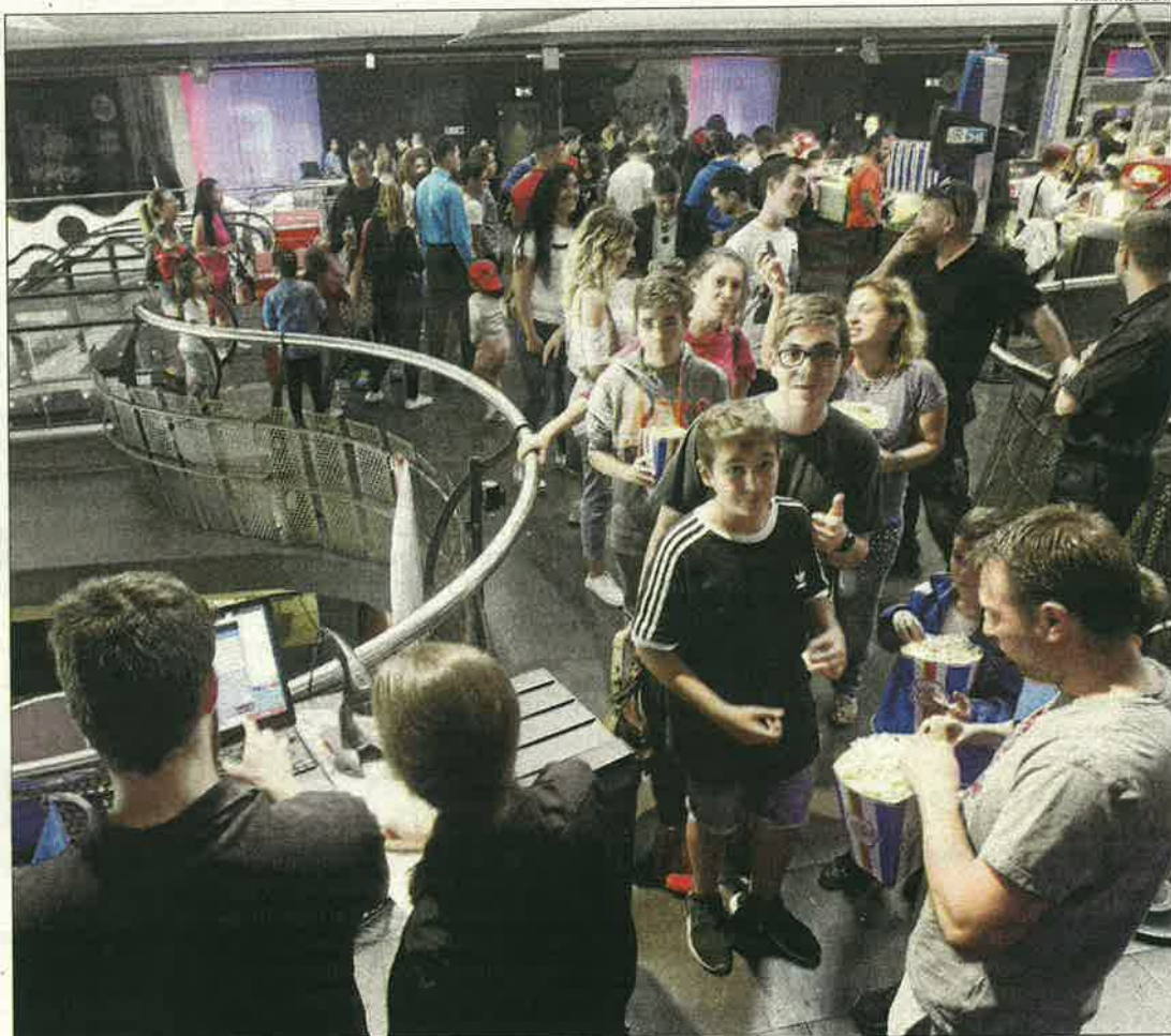
Espectadors a la Festa del Cinema el maig passat a JCA Alpicat.

Si les xifres d'espectadors són descoratjadores, no passa el mateix amb la recaptació. En l'última dècada, es va passar de 4,26 milions d'euros per venda d'entrades el 2007 a gairebé 4,8 l'any passat, mig milió d'euros més, la qual cosa significa un augment al voltant del 12%, que reflecteix també el gradual increment del preu de les localitats. En aquest sentit, la província de Lleida s'ha comportat com la resta del país, com demostra el rànquing provincial de recaptació. Liderat com és habitual per Madrid i Barcelona, Lleida es va situar l'any passat al lloc 28 entre 52 províncies, superant el 29 dels anteriors tres anys i millorant el 31 del 2007.